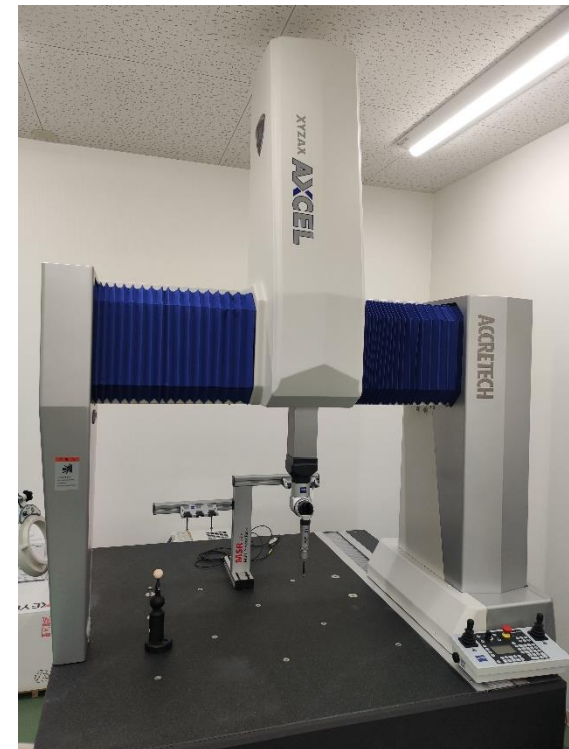
2021年12月導入 三次元座標測定機