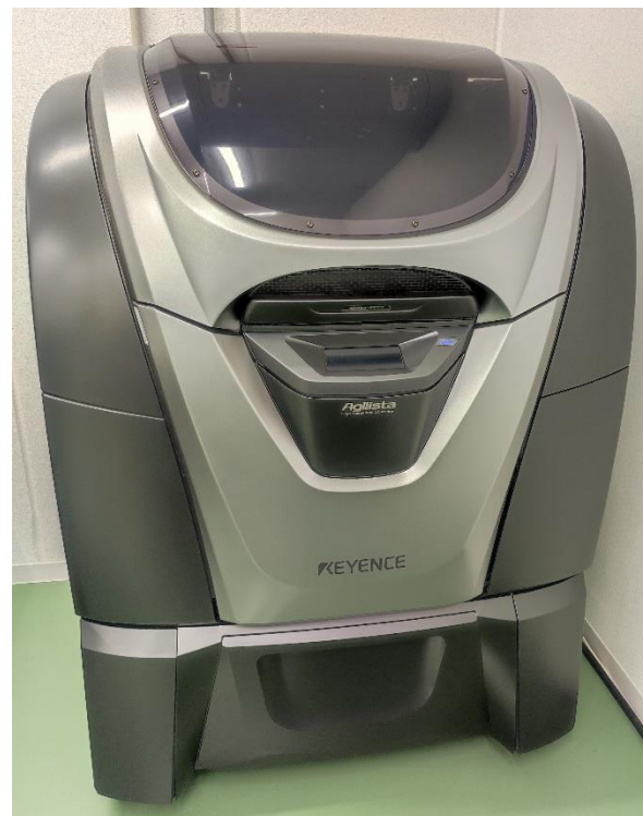
2021年12月導入 3Dプリンター

安定した良品作りは評価出来て初めて効果を確認出来ます。 当社技術を裏付けする測定設備も充実しています。